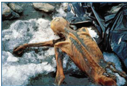
Figure 1. Otzi : le plus vieux tatouage humain.

Connaissez-vous Otzi, notre ancêtre autrichien du Néolithique (5 300 ans avant JC), un chasseur mort accidentellement et dont le corps s'est retrouvé immédiatement congelé dans un glacier ( figure 1 ) ? Il présente des tatouages parfaitement conservés sur sa peau, les plus anciens qu'on ait pu observer sur une peau humaine. Mais on sait que