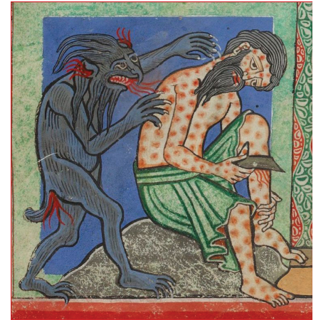
Figure 4. Livre de Job : la maladie envoyée par le dieu pour éprouver la foi humaine.

Les maladies, elles aussi, sont vécues comme tombées du ciel : surtout quand