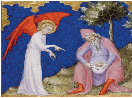
Figure 2. La circoncision : l'alliance du peuple à son dieu.

marquée, depuis le prophète Abraham, est celle d'une Alliance du peuple à son dieu (figure 2).